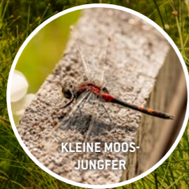
KLEINE MOOS- JUNGFER