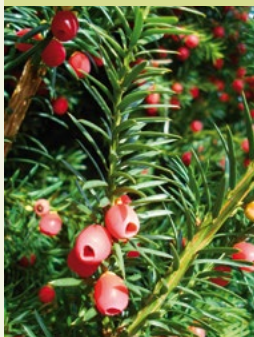
Die Eiben am Westufer des Sees sind eine Besonderheit und als Naturdenkmal geschützt.