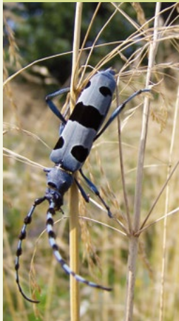
Der Alpenbock liebt alte Buchenwälder , welche er rund um den Walchensee findet.