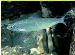
Renken gehören zu den prägenden Fischarten in oberbayerischen Seen.

Eine weitere Besonderheit bietet die Ufervegetation des Walchensees. Die naturnahen uferbegleitenden Wälder am Westufer sind durch ihren hohen Anteil an Eiben besonders wertvoll und schützenswert.